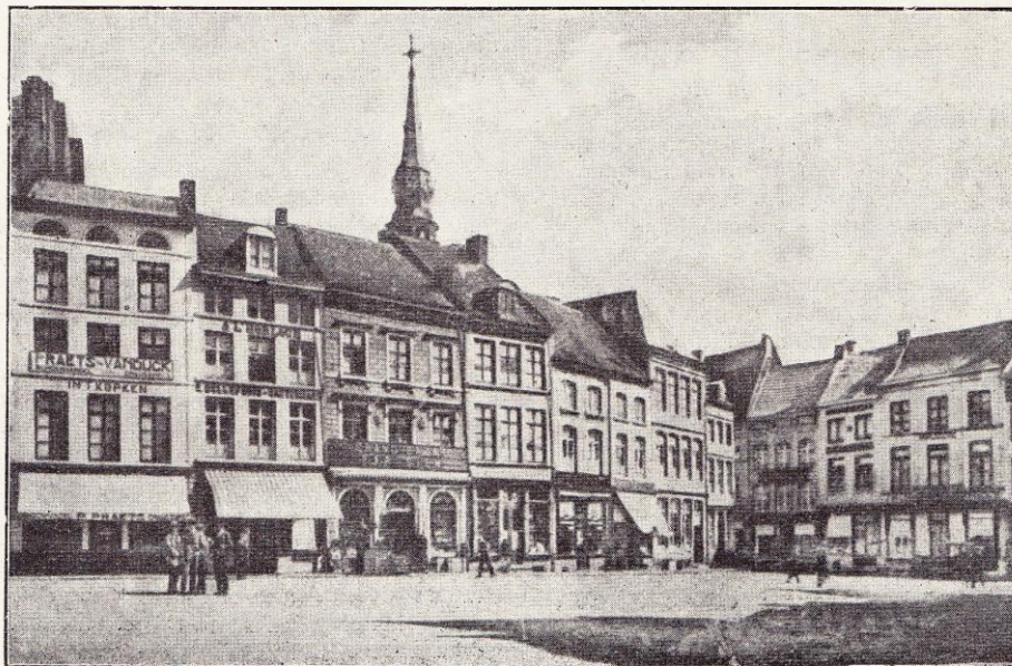
Hasselt. — La Grand'Place.

Quant à un développement économique et industriel de cette contrée pauvre, on eût traité de fou, il y a vingt ans, celui qui y eût songé. Il y