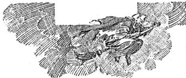
Table des matières du " Diable en Belgique " Roberto J. PAYRO (ou Payró ) : IEA3637 PARTIE 1 (pages I-37 : "LE DIABLE ARCHITECTE", "UNE CREATURE D'APOCALYPSE" (LE "VERT-BOUC"), "LE PACTE AVEC LE DIABLE", "LE STRATAGEME DE SAINT-REMACLE", "LE TILLEUL DES PENDUS" et "LE SORCIER DU CONDROZ".) :